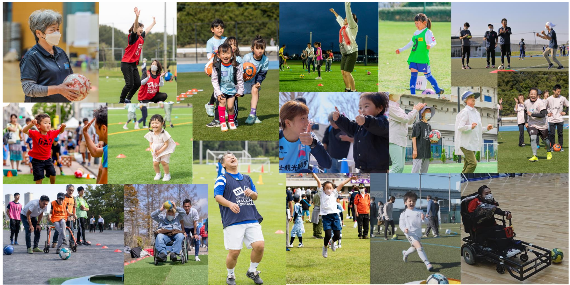
一例のご紹介 (動画)

今まで、様々なTPOに対してイベントを提供し、その全てで高い評価を得ています。 過去のイベント事例・実績につきましては、お手数ですが協会HPより是非ご確認ください。